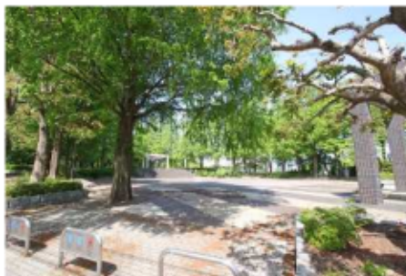
上柴中央公園 (徒歩7分~8分/約530m~約590m)