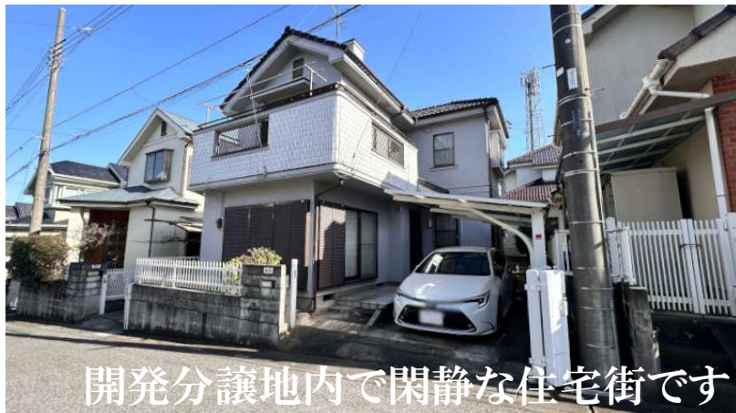
開発分譲地内で閑静な住宅街です